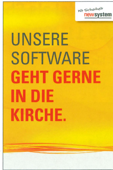
Abb.: INFOMA Software Consulting GmbH

Als einer der ersten Nutzer startete die Evangelisch-lutherische Landeskirche Hannovers zum 1.1.2009 mit einer Pilotkirchengemeinde in den Echtbetrieb. In der Folge wurden weitere 18 Kirchenämter auf das neue kirchliche Rechnungswesen umgestellt. Ebenfalls Anwender der INFOMA-Lösung sind die Evangelische Kirche in Deutschland EKD, die Evangelisch-lutherische Kirche in Oldenburg, das Bistum Osnabrück sowie die Katholische Hochschule Nordrhein-Westfalen.